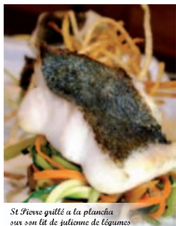
St Pierre grillé à la plancha sur son lit de julienne de légumes

Un mur de pierres apparentes, une belle cheminée centrale, une vaisselle raffinée, des chaises en fer forgé, de jolis meubles en bois travaillé à la main... l'endroit est lumineux et aéré, propice à une délicieuse dégustation.