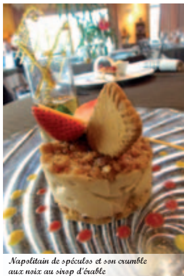
Napolitain de spéculos et son crumble aux noix au sirop d'érable