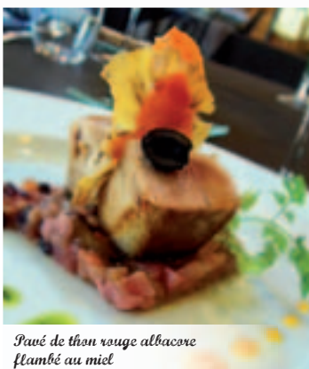
Pavé de thon rouge albacore flambé au miel