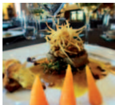
Filet mignon de veau à l'huile de noix de macadamia, ris de veau en éclats de noisette, gnacchi farcis aux cèpes

Mention "immanquable" pour le Menu Express du midi, en semaine: 20€ entrée/plat/dessert... imbattable eu égard à la qualité gastronomique des plats. Ensuite, le Menu BIB Gourmand est à 32€ (rappelons au passage que La Fleur de Sel a reçu cette distinction du Guide Michelin en 2011, gage d'un excellent rapport qualité/prix). Le menu Déclinaison Gourmande est à 42€, enfin le menu Dégustation à 62€ offre un voyage extraordinaire au pays des saveurs.