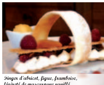
Finger d'abricot, figue, framboise, légèreté de mascarpone vanillé

Une exposition d'un artiste du cru décore les murs du restaurant, à découvrir sans tarder... sur la page suivante!