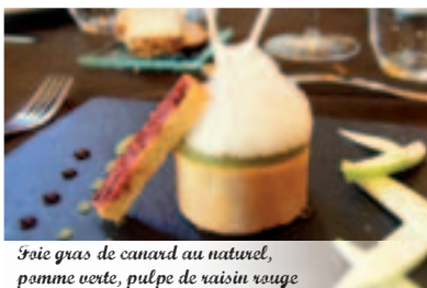
Foie gras de canard au naturel, pomme verte, pulpe de raisin rouge à la moutarde à l'ancienne

Le livre des vins reflète toutes les âmes viticoles pour tous les goûts et toutes les bourses. Une belle sélection de demi-bouteilles, idéales pour un repas amoureux. Les vins de Savoie y sont aussi qualitativement représentés. A noter, la part belle donnée aux viticulteurs biodynamiques.